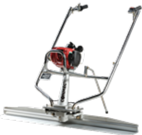
Surface Finishing Screed CSD