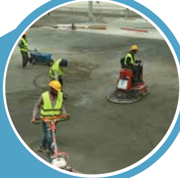
AL WATANIYA CENTRAL WAREHOUSE