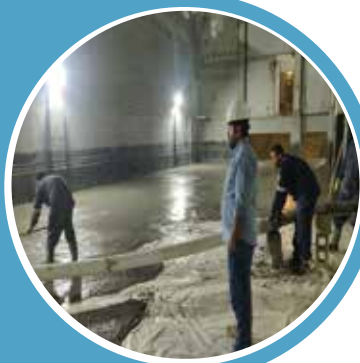
AL NARJIS SUBSTATION