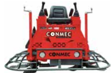
Ride on Power Trowel