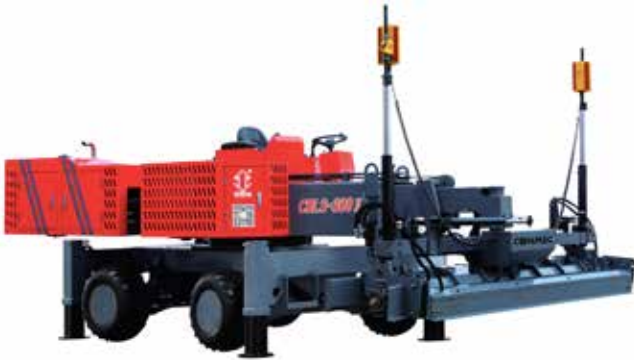
Boom Concrete Laser Screed machine.