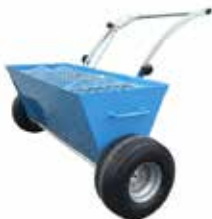
Topping Material Spreader