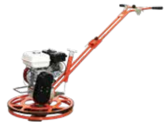
Edging Power Trowel