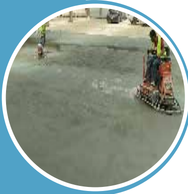
URAIDAH 02 SUBSTATION