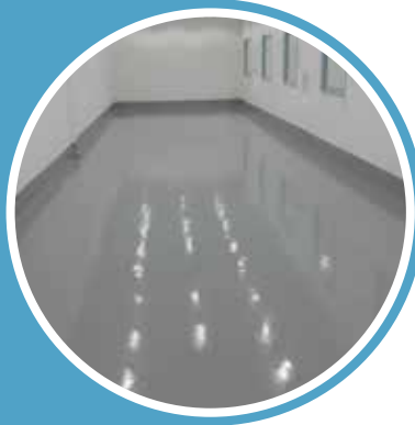
AL DIRIYAH HOSPITAL