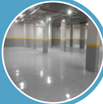
STC CAR PARKING TP3