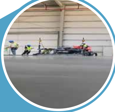
AL ARID SUBSTATION