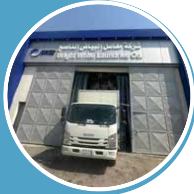
AL BAYAD NASEA LAUNDRY