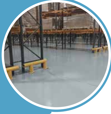
AL HUSSAIN TOP-UP WAREHOUSE