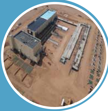
URAIDAH 01 SUBSTATION