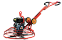
Walk-behind Power Trowel