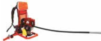
Vibrator Poker CVP